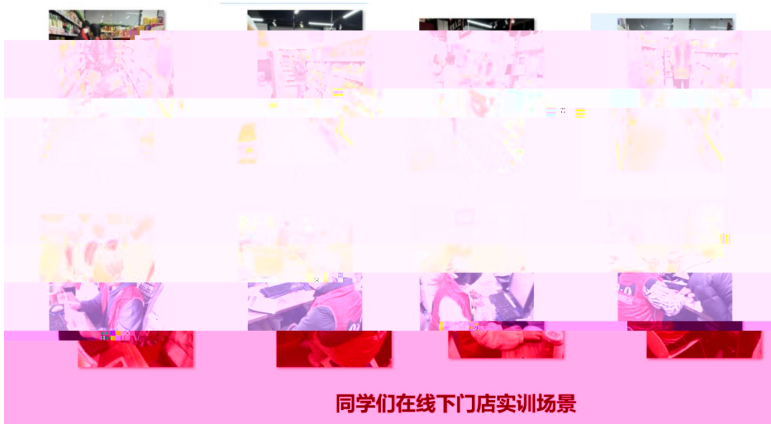
同学们在线下门店实训场景